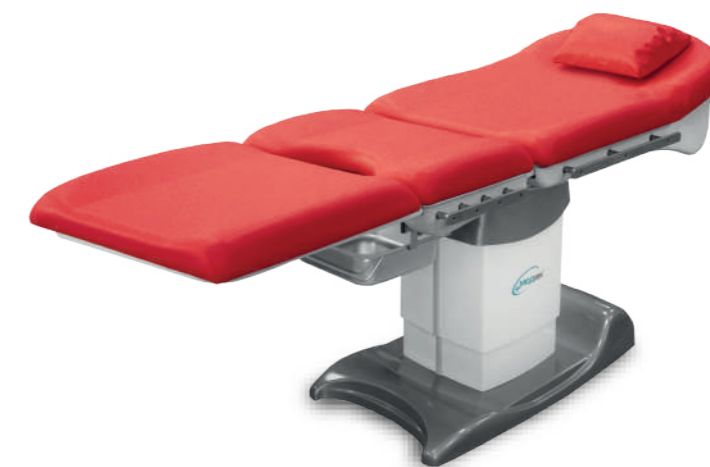
Положение «стол» (КГМ-3П)